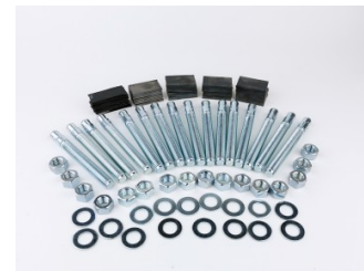
Ensemble d'ancrages et cales