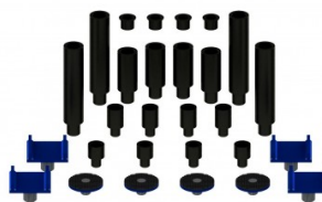
Rallonges et mains de levage