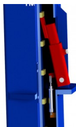
Système de verrouillage automatique