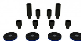
Rallonges et mains de levage