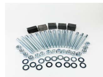
Ensemble d'ancrages et cales