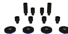
Rallonges et mains de levage