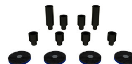
Rallonges et mains de levage