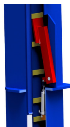
Système de verrouillage automatique