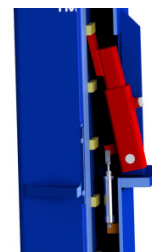
Système de verrouillage automatique