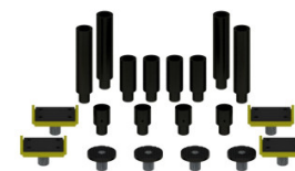
Rallonges et mains de levage