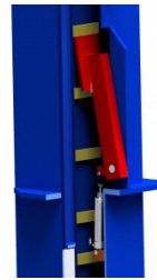
Système de verrouillage automatique