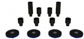
Rallonges et mains de levage