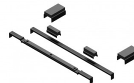
Accessoires de soutien