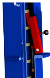
Système de verrouillage automatique